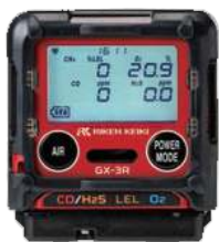
Apariencia cuando esta colocada.