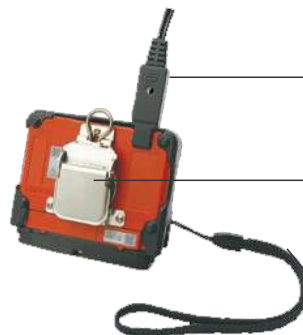
Adaptador de CA (Part No. 2594 0898 30)