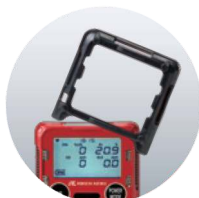
Cubierta protectora (Part No. 4777 4161 10)